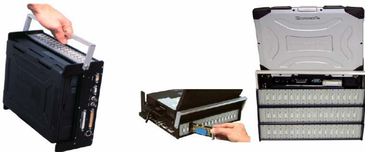
Подключаемые модули преобразования сигналов - Пример 48-канальной версии

Если прибор эксплуатируется в среде с высокими требованиями по ударопрочности и виброустойчивости, мы рекомендуем использовать популярные DAT-рекордеры нашей компании для передачи данных на ноутбук в режиме офлайн или прямой передачи с помощью телеметрии, если это необходимо.